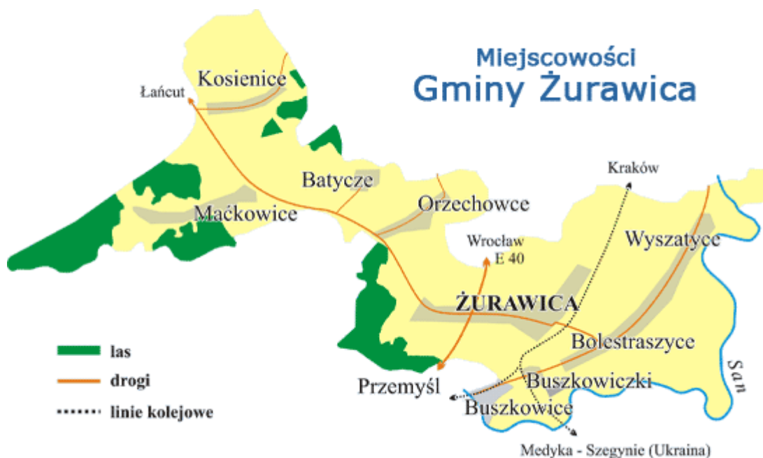
Rys. 1. Gmina Żurawica: Źródło: opracowanie własne

Powierzchnia Gminy wynosi 9575 ha. Zamieszkuje ją 12 930 mieszkańców (według danych na koniec 2014 r.), co powoduje, że gęstość zaludnienia wynosi 128 mieszkańców na km 2 . Podstawową funkcją Gminy jest rolnictwo, funkcje uzupełniające to turystyka i wypoczynek. Wybór tych funkcji spowodowany jest położeniem geograficznym i ukształtowaniem terenu.